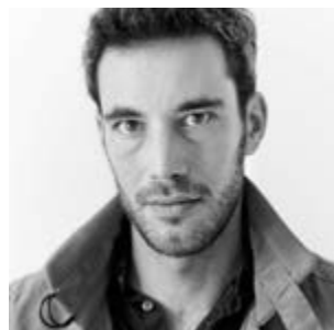
Eran Oppenheimer Fotograaf