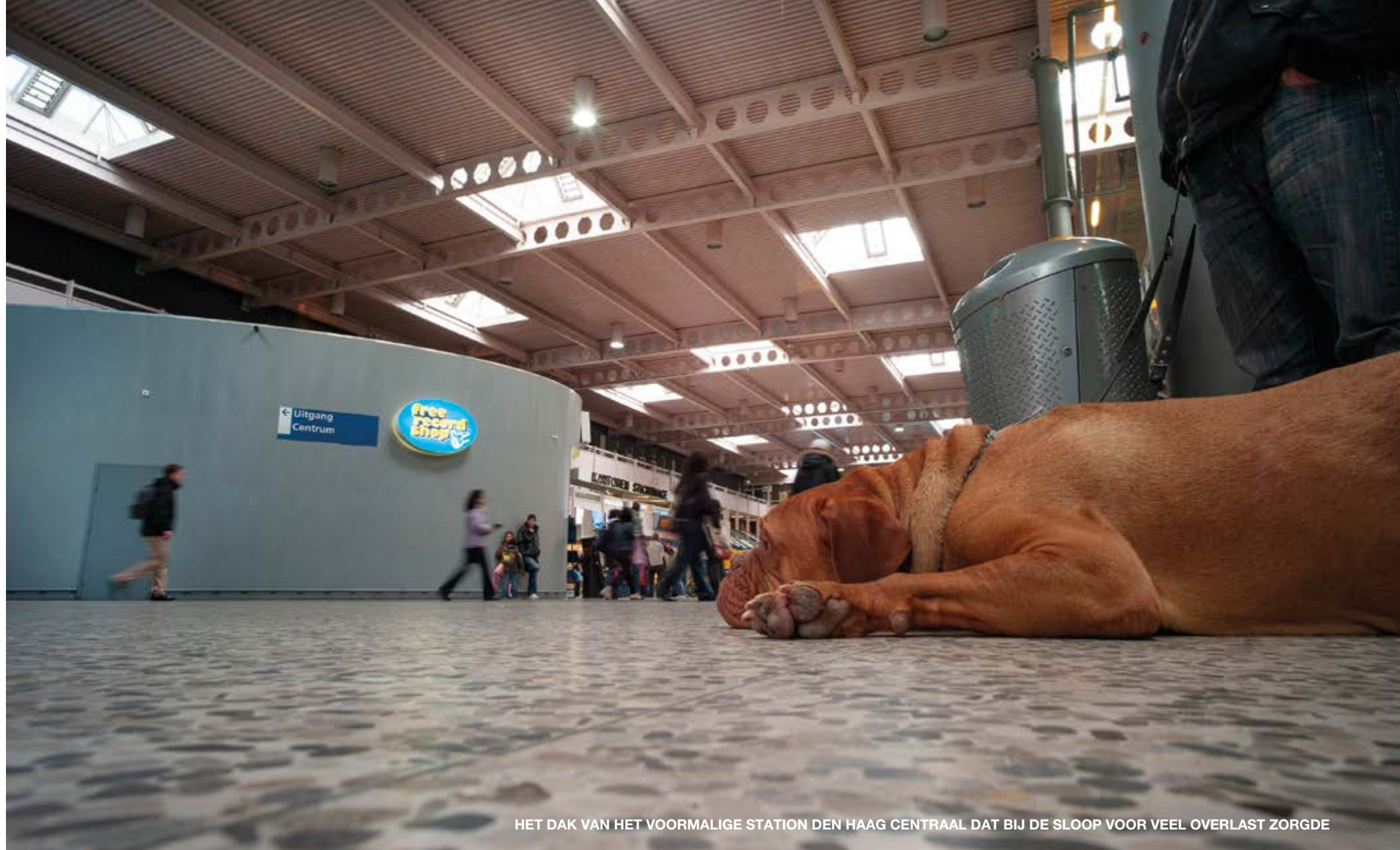
HET DAK VAN HET VOORMALIGE STATION DEN HAAG CENTRAAL DAT BIJ DE SLOOP VOOR VEEL OVERLAST ZORGDE

Zo ging de bouw met een simpele aanpassing volgens planning door. De omwonenden dankten de communicatieadviseur voor het luisterende oor. Ze hebben zich daarna niet meer negatief laten horen over de werkzaamheden.