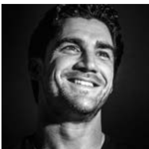
Emil Golshani Fotograaf