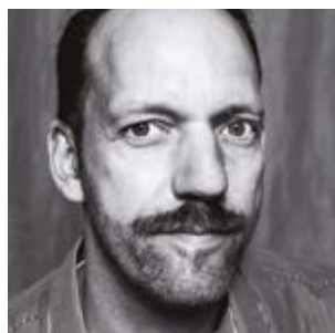
Martijn Gijsbertsen Fotograaf